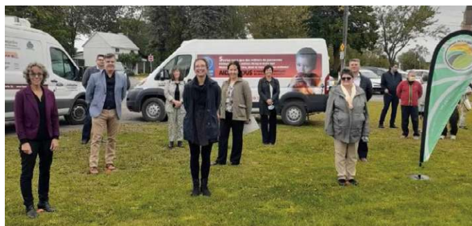
Les différents partenaires ont participé à la conférence de presse marquant le lancement du projet régional (septembre 2020).

« Bien que ce projet soit mis en place pour répondre aux besoins criants générés par la crise sanitaire actuelle, il permettra l'établissement de pratiques durables entre les différents partenaires. »