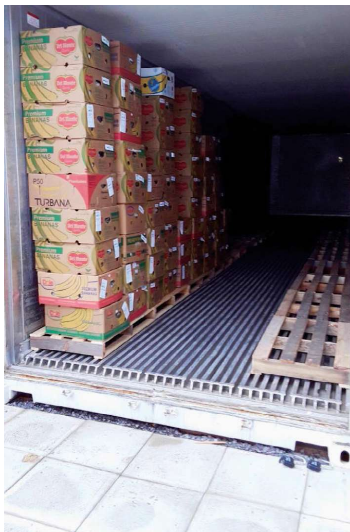
Première livraison des denrées transformées dans le cadre du projet régional : betteraves, courges, carottes et asperges sous toutes leurs formes (octobre 2020).

Afin de permettre une récupération alimentaire plus efficace et à plus grande échelle, le soutien à la transformation (ressources humaines et matérielles) ainsi que l'accès à des espaces d'entreposage adéquats et à du transport sont fondamentaux.